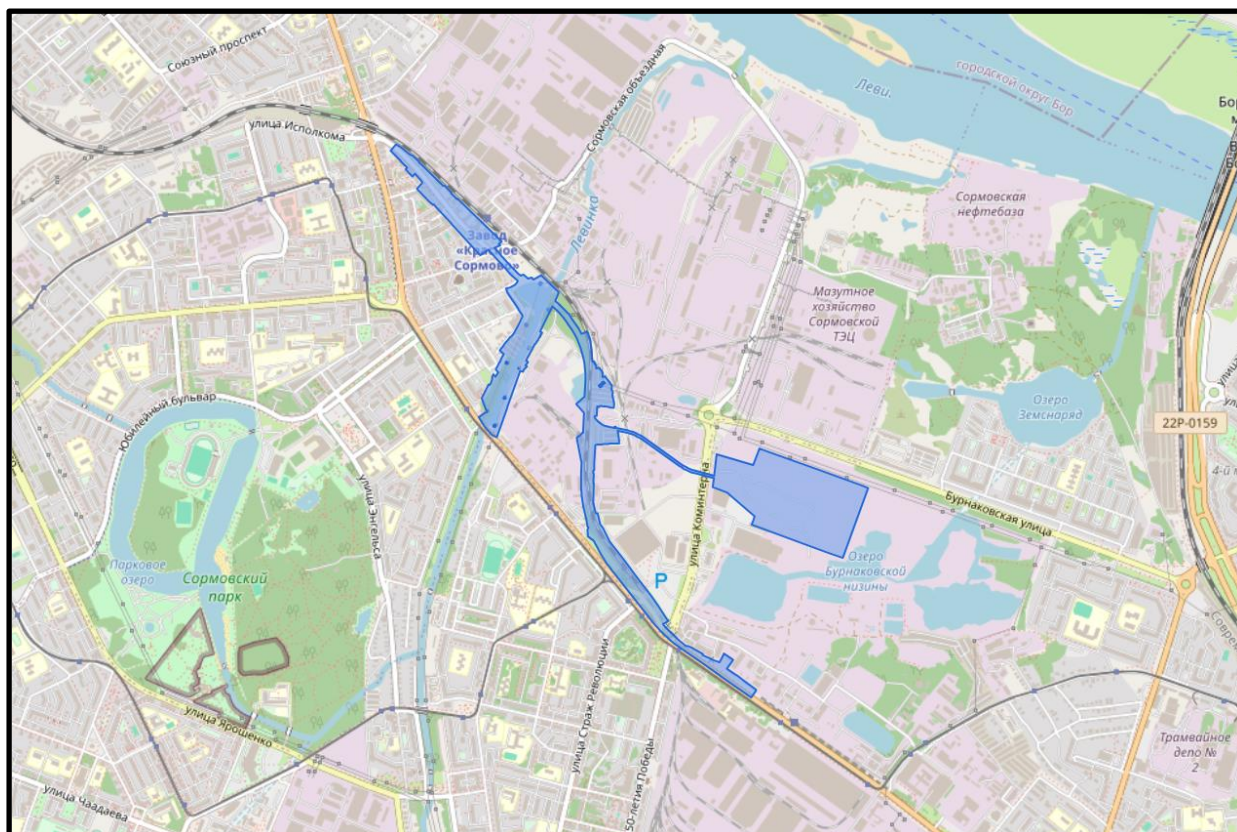
Схема границ подготовки документации по внесению изменений (арх. № 58/24)